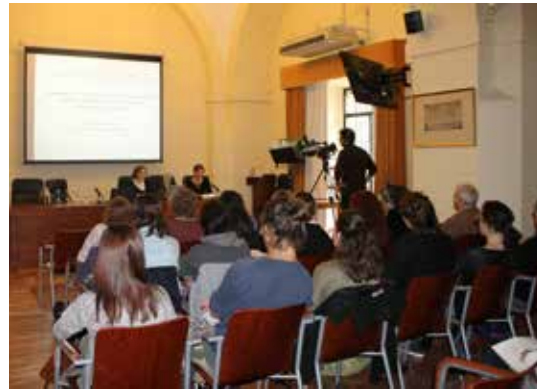
Spanisch-deutsches Symposium »Experiencias Etnográficas en Andalucía« an der Universität Sevilla, 21.- 22.03.2013

Das Rahmenprogramm der Lehrforschung stand im Zeichen von Al-Andalus, dem Spanien der maurischen Zeit. Wir haben eine Exkursion in die Stadt Córdoba unternommen, die berühmte Moschee-Kathedrale und das »Museum der Drei Kulturen« über das Zusammenleben von Juden, Christen und Moslems besucht. Sevilla haben wir ebenfalls historisch-kulturell erkundet, u.a. besichtigten wir die Kathedrale, den maurischen Palast »Alcázar de los Reyes« und das »Museo de Arte Contemporáneo«, in dem stadthistorisch bedeutsamen Gebäudekomplex La Cartuja gelegen, ehemals Kartäuserkloster und Keramikfabrik.