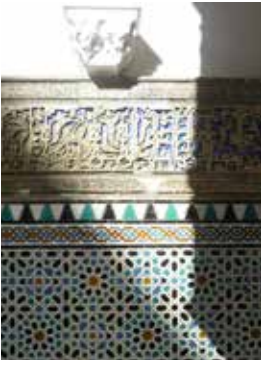
»Alcázar de los Reyes« in Sevilla