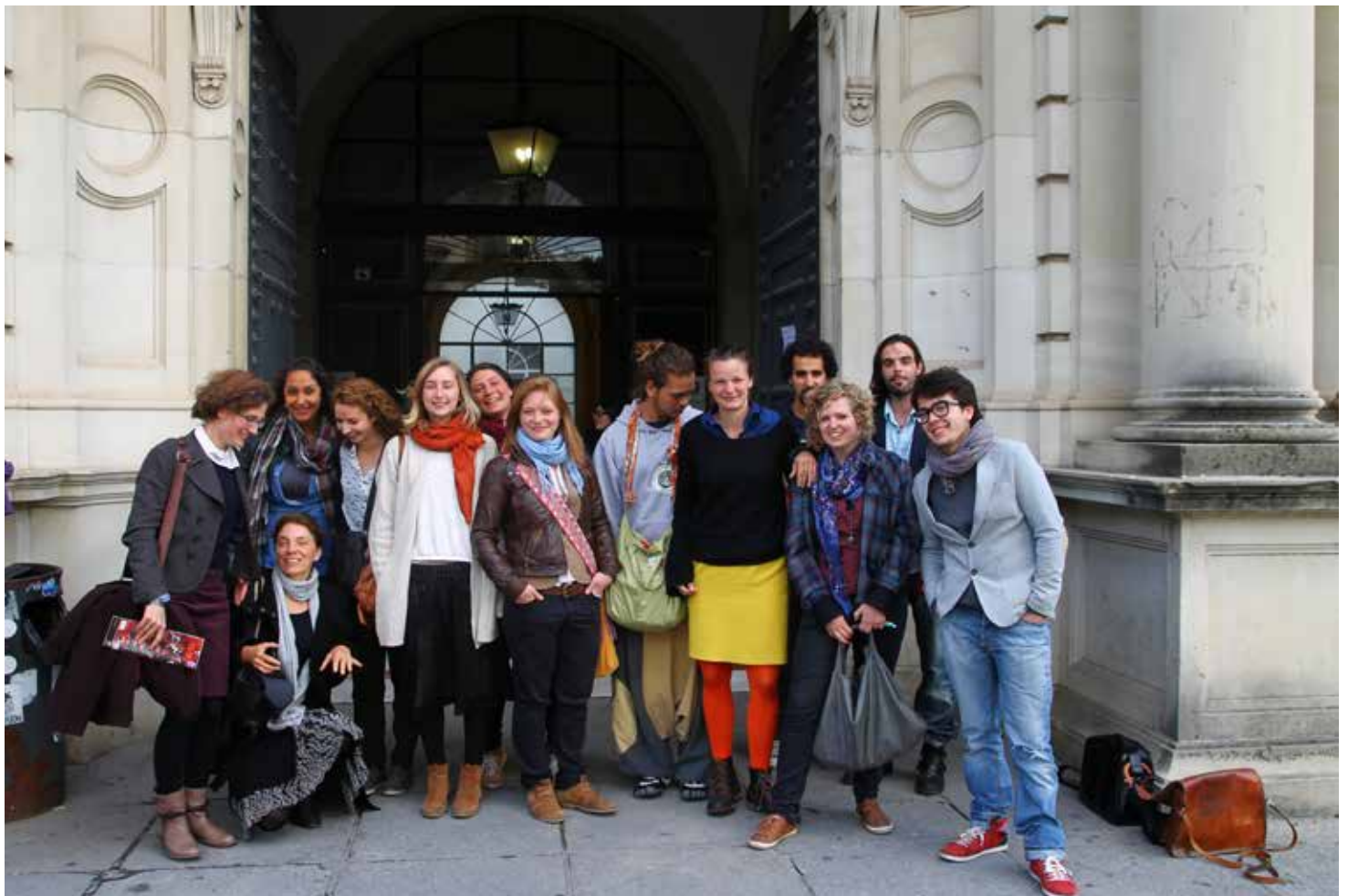
Vor der Universität Sevilla, von links: Dozentinnen, deutsche und spanische Studierende

Für die Wahl Sevilla sprach auch die besondere Charakteristik dieser Stadt. Sie stellt zusammen mit dem ländlichen Hinterland ein gutes Forschungsfeld dar, weil sich hier wichtige Themen der ethnologischen Forschung zum mediterranen Raum wiederfinden. Außerdem ist die aktuelle krisenhafte Entwicklung im südlichen Europa in der traditionell strukturschwachen Region Andalusien besonders präsent, und auch transnationale Arbeitswanderungen zwischen Lateinamerika,