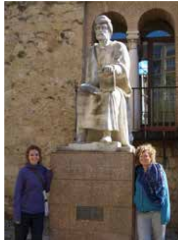
Zwei Studentinnen neben einer Statue von Averroes, dem arabischen Philosophen und Arzt im Córdoba des 12. Jh.