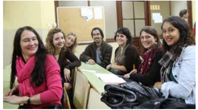
Im gemeinsamen Unterricht, Institut für Kultur- und Sozialanthropologie, Universität Sevilla

»Außerdem ist die aktuelle krisenhafte Entwicklung im südlichen Europa in der traditionell strukturschwachen Region Andalusien besonders präsent ...«