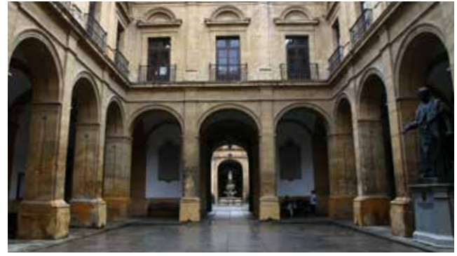
Innenhof der Universität Sevilla, ehemalige Tabakfabrik

Afrika und Europa zeigen sich an der EU-Südgrenze in verdichteter Form. Diese beiden Thematiken, Krise und Migration, wurden aufgrund ihrer Aktualität und Brisanz Schwerpunkte der studentischen Forschung.