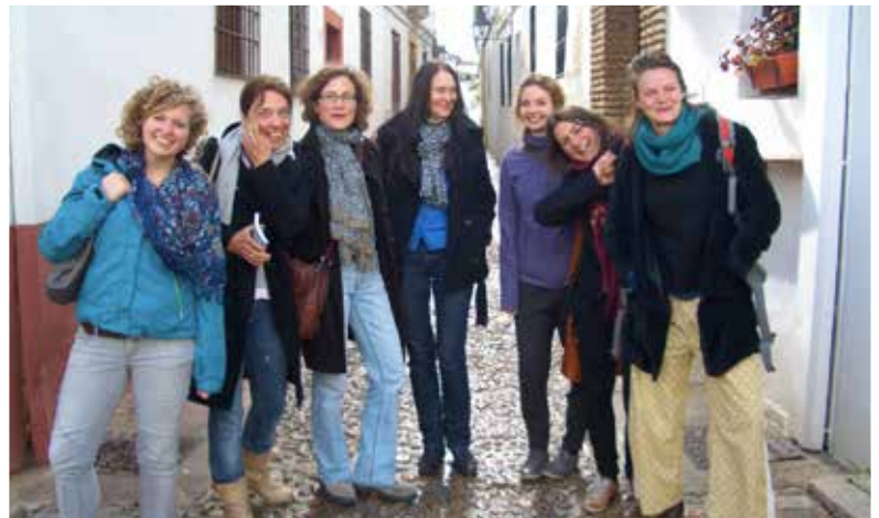
Gruppenfoto in einer Gasse des Jüdischen Viertels von Córdoba

Gesamtprozess ethnographischen Vorgehens kennengelernt. Im Vorfeld der Lehrforschung erarbeiteten sie Themenfelder und verfassten jeweils ein Exposé, in dem sie ihre Forschungsfrage und Methodik umrissen. Im Anschluss an den Aufenthalt in Sevilla haben wir uns im Sommersemester 2013 mit der Aufarbeitung und Auswertung der Felddaten beschäftigt. Als Ort der Lehrforschung wählten wir die Hauptstadt Andalusiens. Begünstigt wurde dies durch ein sich damals bereits in Planung befindendes (und mittlerweile unterzeichnetes) »Akademisches und Studentisches Austauschabkommen« mit der Universität Sevilla. Wir standen und stehen in engem Kontakt mit Prof. Manuela Cantón Delgado und Prof. Richard Pfeilstetter vom Institut für Kultur- und Sozialanthropologie.